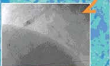
Кровоток TIMI 3